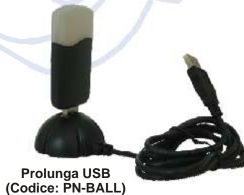
Prolunga USB (Codice: PN-BALL)